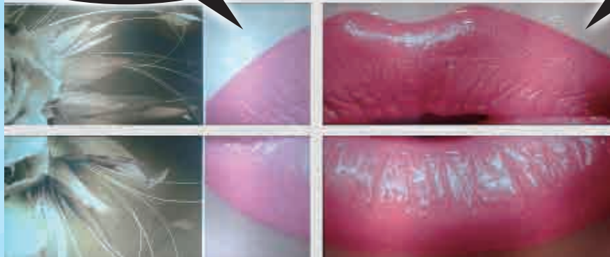
透明壓克力彩白彩噴繪 背部日光燈打光